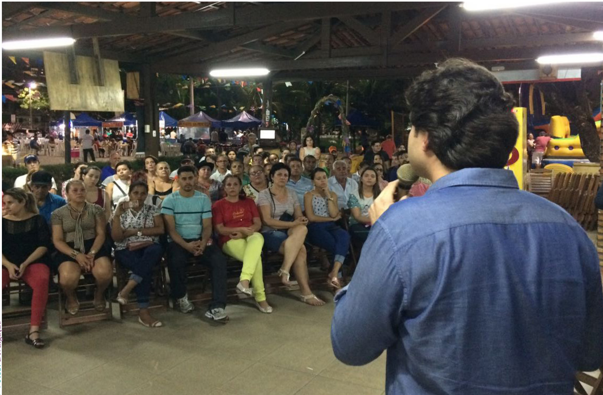
O espaço no entorno do Lago Jacarey possui um dos maiores polos de gastronomia de Fortaleza

A Prefeitura de Fortaleza realiza ações de incentivo aos micro e pequenos empreendedores. Setenta termos de permissão foram entregues aos empreendedores da Praça do Lago Jacacarey, no bairro Cidade dos Funcionários. A partir de agora, os permissionários podem atuar, de forma regular, nas áreas de artesanato e gastronomia.