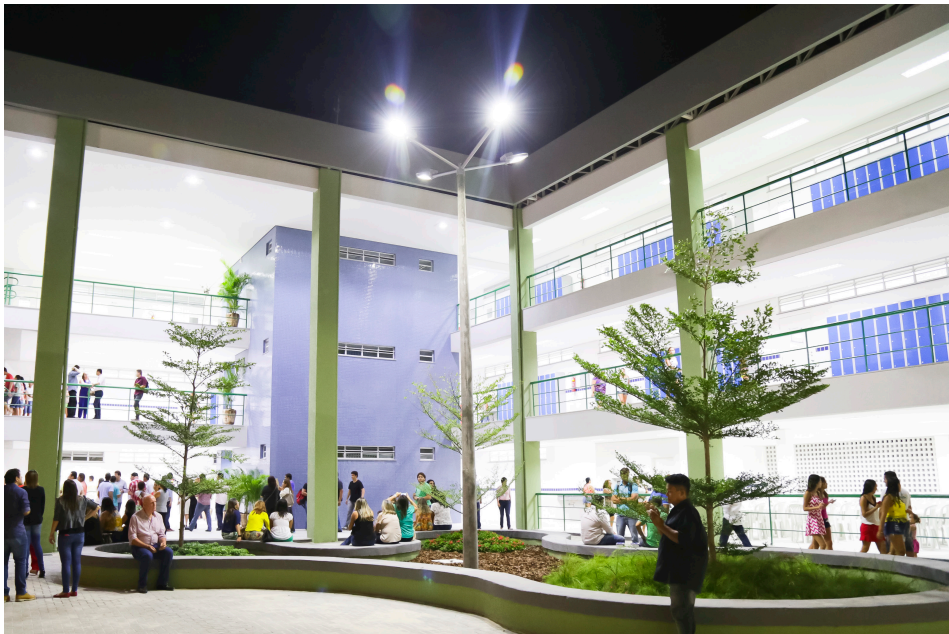
Os jovens participaram da primeira edição do Projeto Integração, que envolve os alunos das escolas municipais em tempo integral

O prefeito Roberto Cláudio inaugurou a Escola de Tempo Integral Edgar Linhares Lima, no bairro Planalto Ayrton Senna, na Regional V, no dia 12 de janeiro. Esta é a 14ª escola de tempo integral entregue à população fortalezense desde o início da atual gestão e é a primeira com prédio totalmente novo. De acordo com o prefeito, a escola de tempo integral oferece educação de qualidade e a formação de cidadania do aluno. “É uma escola com uma belíssima infraestrutura para atender mais de 450 alunos, garantindo a melhor estrutura em um bairro pobre, que tem muita demanda da juventude por espaço de lazer. O equipamento vai oferecer, além da escola o dia inteiro, um caminho de oportunidade para estes jovens”, comentou. Além da nova estrutura, novos professores serão contratados para a rede municipal de ensino. “Para além da escola, estamos investindo também em pessoal. No final do mês, vamos chamar 1.679 novos professores concursados. É um prédio novo, com infraestrutura de ponta, mas também com novos professores e uma boa gestão, que será fundamental para acompanhar o dia a dia do aluno, fazendo com quem ele aprenda, se desenvolva, que possa se tornar um bom aluno e,