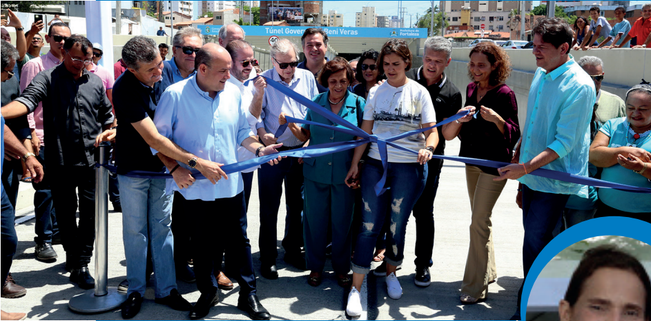
Roberto Claudio - Prefeito

“Hoje temos mais um túnel entregue. Ele permite que a Via Expressa realmente se torne expressa, sem semáforos, ajudando o trânsito e o transporte público com faixa preferencial de ônibus e, além disso, permite conexão mais rápida entre o aeroporto e Mucuripe”